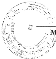
Mr.sc. Čedo Petrina kap.dug.plov. ravnatelj

Ove financijske izvještaje koji obuhvaćaju stranice od 1 – 46. odobrio je zakonski zastupnik na dan 22. veljače 2019. godine i potpisani su od strane: