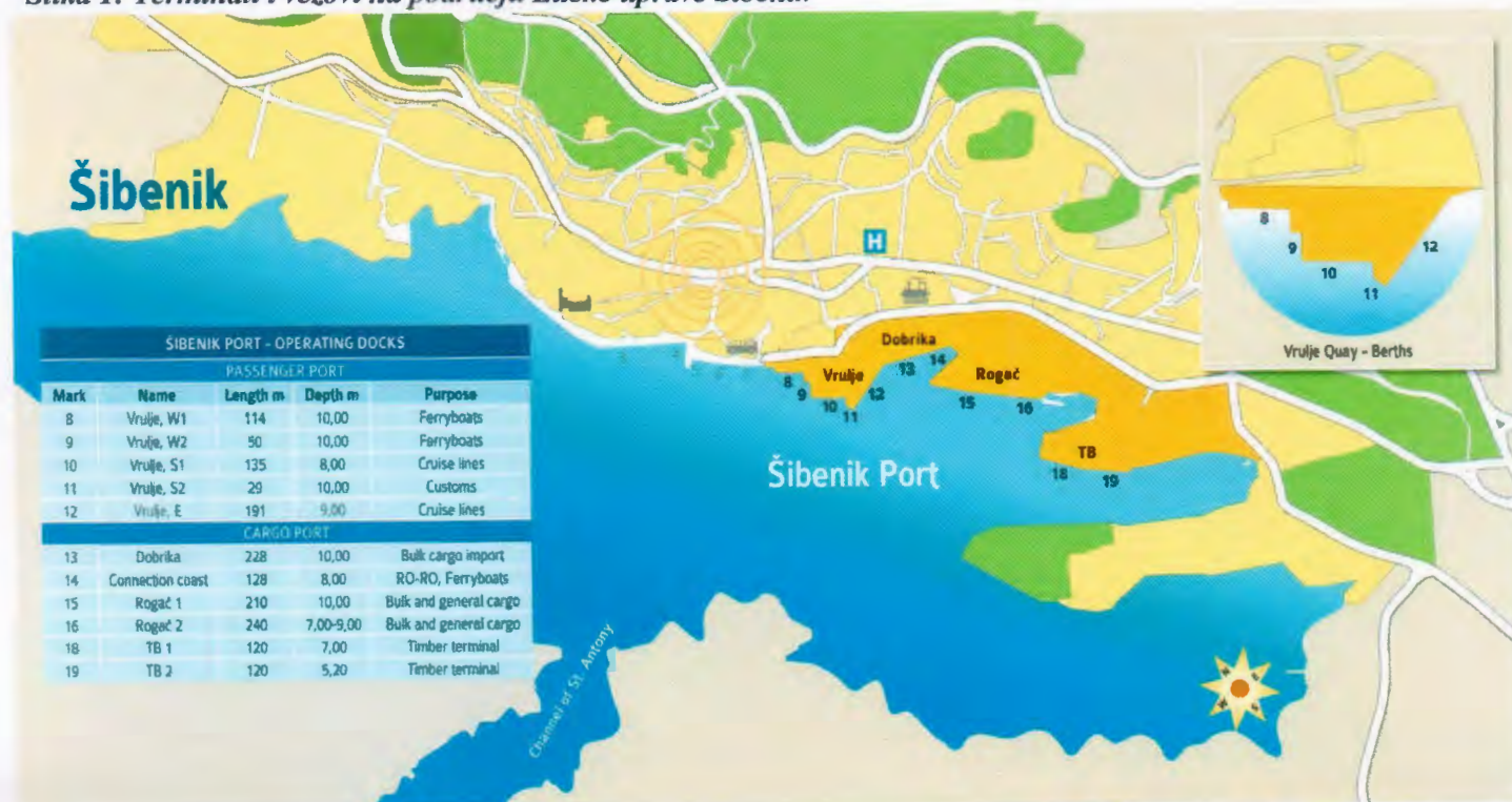
Slika 1: Terminali i vezovi na području Lučke uprave Šibenik