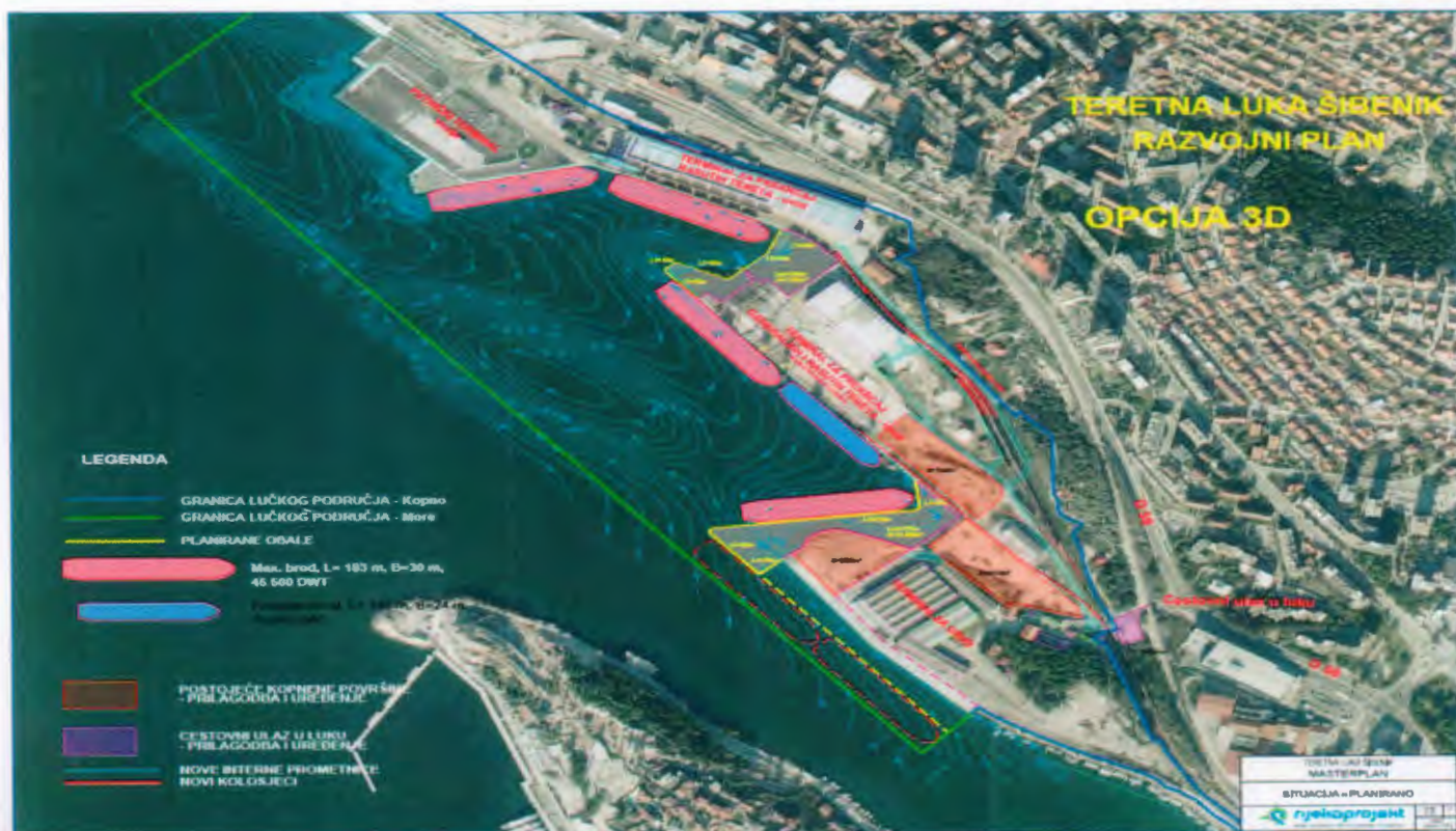
Slika: Planirani zahvati u projektu Modernizacija lučkog područja luke Šibenik – teretni dio